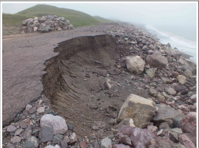
Élargissement de l'effondrement entre la partie la placette centrale