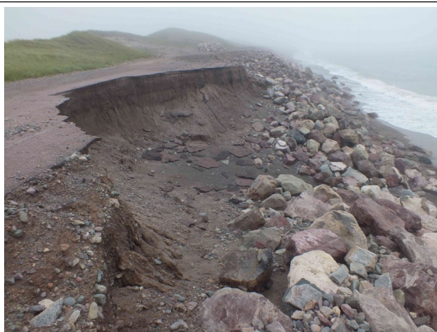
Élargissement de l'effondrement entre la partie digue et la placette centrale

- Légère évolution observée en élargissement sur 4 effondrements.