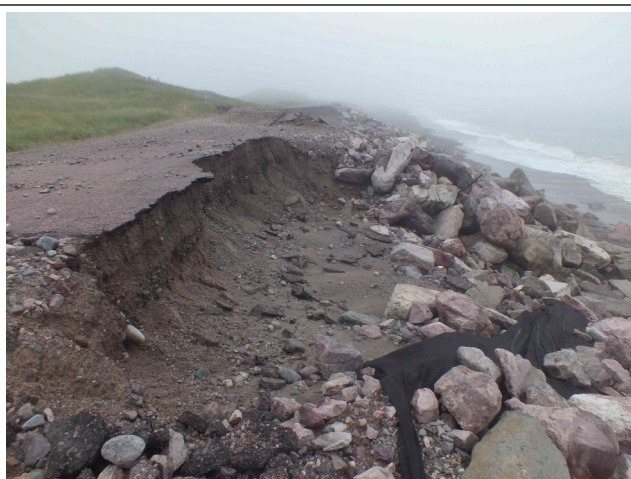
Élargissement de l'effondrement après la placette centrale