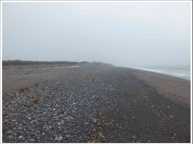
Plage devant la partie parking (nord)